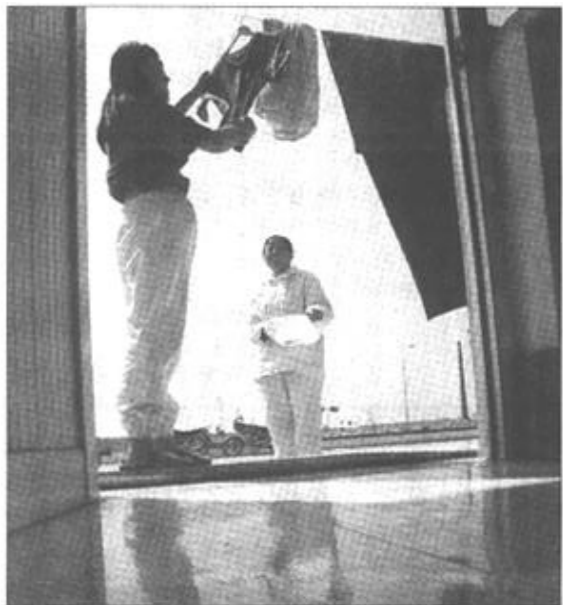
视工作为生命,以岗位为家。简易房是他们工作和生活的场所。