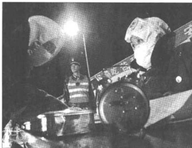
子夜时分,天气寒冷,他们仍然坚守在工作岗位上。