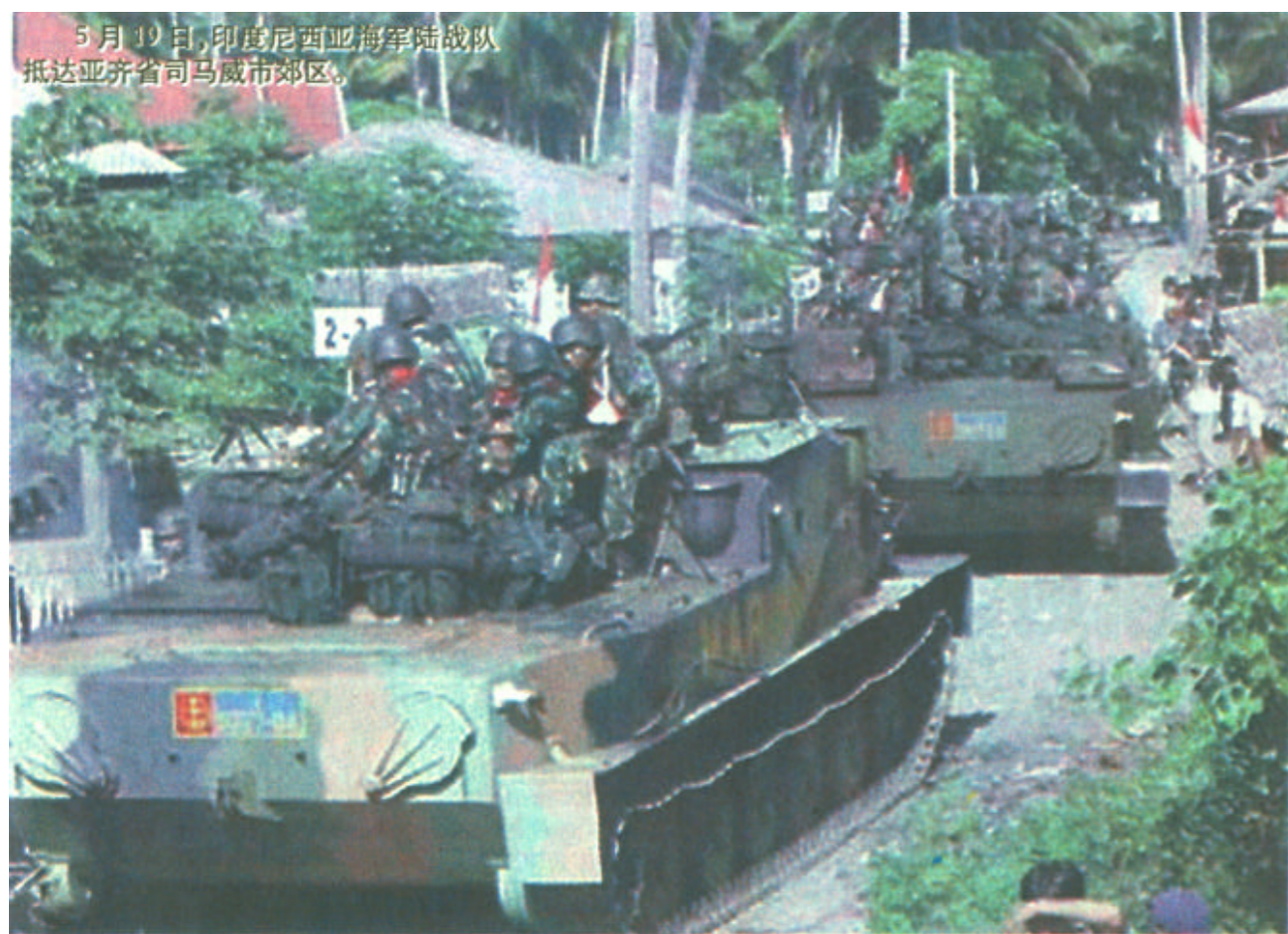
5月19日，印度尼西亚海军陆战队抵达亚齐省司马威市郊区。

自从印尼总统梅加瓦蒂19日凌晨宣布在最西部省份亚齐实施戒严后，印尼军队开始对“自由亚齐运动”武装人员活动地区、特别是亚齐北部地区，实施空中打击和地面围剿。