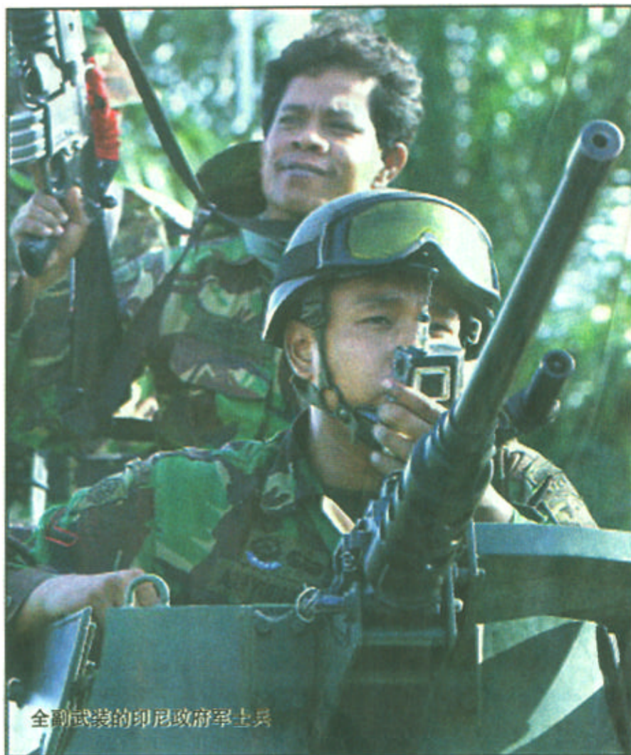
全副武装的印尼政府军士兵