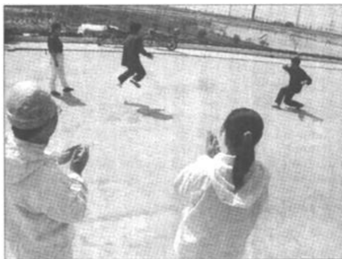
业余时间,只能靠这种简单的游戏方式锻炼身体,以提高队员们的自身免疫力。