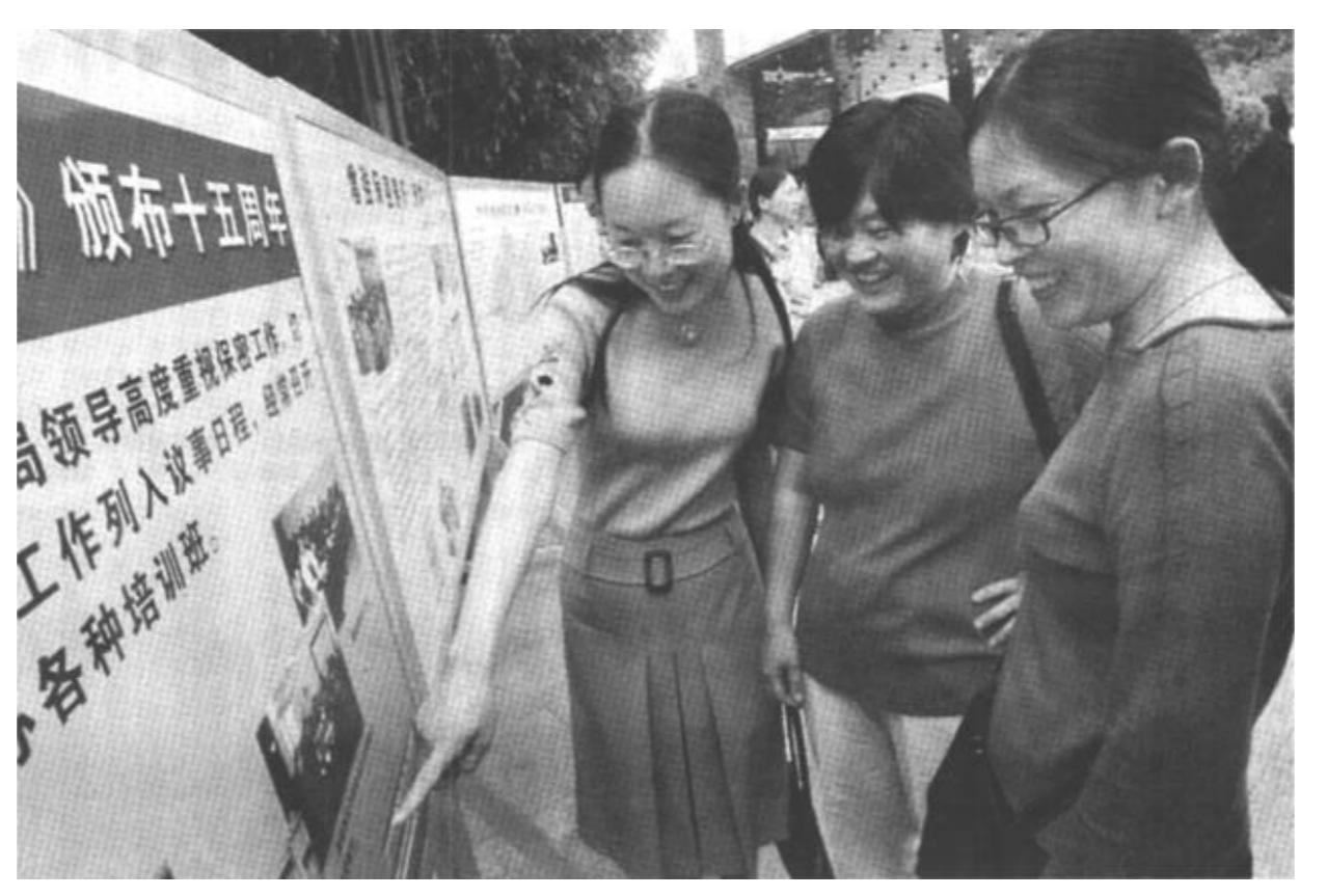
5月21日，为推动《保密法》的贯彻实施和“四五”保密法制宣传教育的顺利开展，市保密委员会在全市开展了纪念《保密法》颁布15周年板报展活动。市直保密干部、涉密人员100多人参观了展览。大量内容丰富、直观形象的图片展示、案例教育、法规制度介绍，充分展示了新形势下认真贯彻《保密法》的重要意义。

本报讯 五年前，一个只经营广告装饰、创意策划、文化艺术传播的民营企业，五年后，一跃发展成为涉足木材综合批发、房地产、生物工程等多个领域的综合性经营公司。迪发实业有限公司五年建成发展平台，实现了民营企业的跨越式发展。敢为人先，站稳脚跟。“一把尺子一支笔，一部电话一电锯”，这就是成立之初的迪发广告装饰工程有限公司。迪发公司深知，要想从众多同业公司中脱颖而出，只有“别出心裁”。于是，一个个第一，在迪发、在东营应运而生。首家利用社会力量成功举办“太平洋之夏”夏滩音乐节，首家在露天体育场举办作为民间庆祝建市十五周年“迪发之光——刘欢、那英、黄宏、郁钧剑大型歌舞晚会”，举办首届油城青年卡拉OK歌曲大赛……创新，让人们记住了迪发。之后，迪发公司又成功发起了“世纪婚礼”、“胜利油田——海尔集团携手共迎新世纪”等一系列策划创意，拓宽了发展空间。多业并举，发展壮大。靠着创新，迪发公司在2年时间内就已稳立潮头。从2000年开始，迪发又走上了多元化发展壮大之路。经过市场调研，他们筹建了黄河口木材综合批发市场，作为市政府重点招商项目，将于年底投入使用；成立了迪发生物工程有限责任公司，开发种植速生杨1千亩；种植万亩高科技金银花，可望近期形成绿原酸、有机花肥、保健花茶一条龙生产链。“不满足过去，只瞄准未来”，茁壮成长的迪发公司，又与胜利油田国际石油开发投资有限公司合作，瞄向了新的市场。（本报记者）