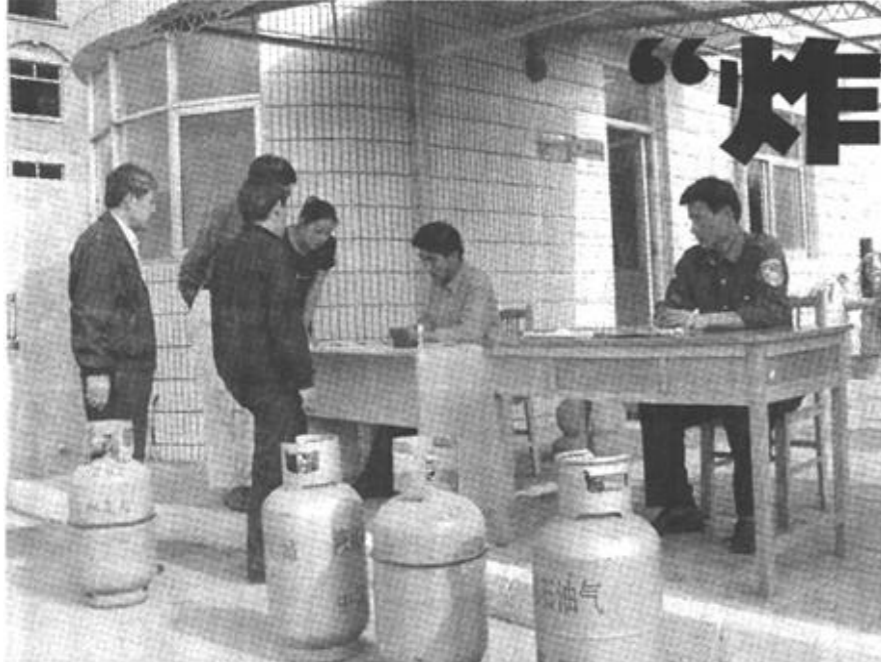
市供气站工作人员正在为居民办理收购手续